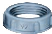
Bucha 3/8" a 4"