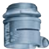
Conector Reto para Box 3/8" a 4"