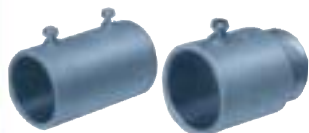
Luva e Conector sem rosca 1/2" a 4"

Fundidas sob pressão em Alumínio Silício, com acabamento em pintura Epóxi-Polyester (exceto Conectores, Luvas, Buchas e Arruelas). Práticas e funcionais.