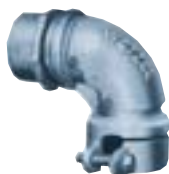
Conector Curvo para Box 3/8" a 4"