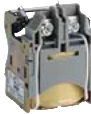
Bobina de Mínima Tensão NS100 a 630