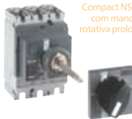
Compact NS 100N com manopla rotativa prolongada