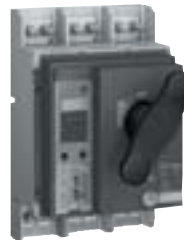
Compact NS 800N com manopla rotativa direta