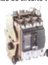
Compact NS 250H em chassi extraível