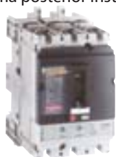
Compact NS 250H encaixável (plug-in)

Segurança, remoção ou inserção rápida do disjuntor sem a exposição das partes vivas. Flexibilidade, os circuitos futuros podem estar prontos para uma posterior instalação do disjuntor. Garantia da segurança, a desconexão do circuito visível.