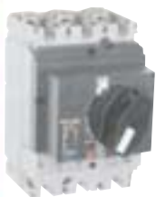
Compact NS 100N com manopla rotativa direta

O acionamento manual pode ser feito através da alavanca de acionamento ou, opcionalmente, por manopla rotativa direta ou prolongada.