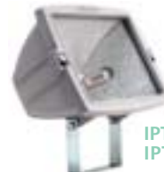
IPT-01/4 e IPT-02/4