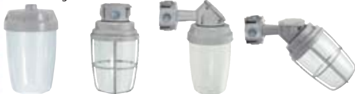
WYP20-2 WYPG25-2 WYP27-2 WYPG26-2