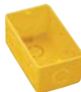
CW 4 x 2