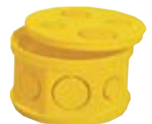
CCW-OCT 4 x 4