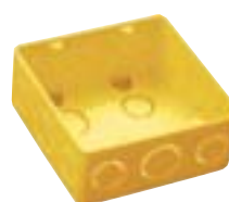
CW 4 x 4