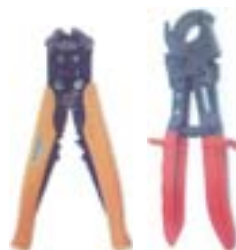
Cortadores de Fios e Cabos

Uma perfeita combinação entre um terminal e o condutor é agora obtida com a mais completa linha nacional de alicates de compressão, manutenção e cortadores/descascadores de fios e cabos. Possuímos alicates para toda nossa gama de terminais, podendo ser de catraca, manual, hidráulico ou pneumático, além de kits de manutenção, contendo um alicate de manutenção e uma ampla seleção de terminais e conectores de qualidade Crimper.