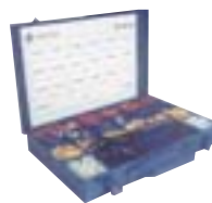
Kits de Manutenção