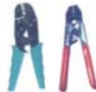
Alicates de Catraca